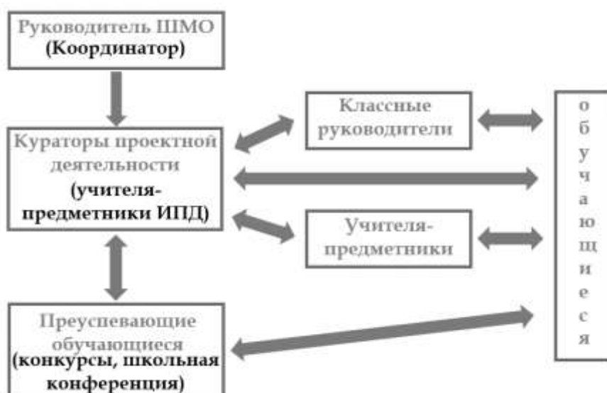
Рисунок 1 – Принцип работы системы наставничества

Руководитель ШМО координирует работу проектной деятельности в образовательной организации. Кураторами проектной деятельности выступают учителя-предметники, осуществляющие преподавание дисциплины «Проектная и исследовательская деятельность». Кураторы проектной деятельности проводят обучающие семинары для учителей-предметников и классных руководителей 9 классов перед началом учебного года. Кроме этого учителя-предметники и классные руководители проходят обучающий курс видеолекций. Данный курс был разработан в рамках работы МИП «Центр проектного творчества» МАОУ СОШ №8 им. Ц. Л. Куникова в 2022 году.