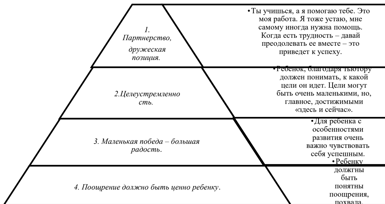
Рисунок 1 - Важные принципы в работе тьютора с ребенком с ОВЗ.

От того, как сложатся отношения тьютора и ребенка с особенностями развития, зависит успешность включения ребенка в образовательную и социальную среду.