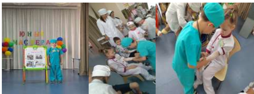
Чемпионат «Юные мастера»

По запросу ДОУ педагоги Геленджикского филиала принимают участие в муниципальном чемпионате «Юные мастера» среди детей старшего дошкольного возраста муниципальных дошкольных образовательных учреждений муниципального образования город-курорт Геленджик в качестве экспертов, а студенты в роли тьюторов.