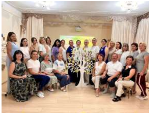
Краевая стажировка «Здоровьесберегающая среда ДОУ как средство сбережения и профилактики ортопедического здоровья дошкольников»

Краевая стажировка по теме «Здоровьесберегающая среда ДОУ как средство сбережения и профилактики ортопедического здоровья дошкольников» проведена совместно с Геленджикским филиалом «Новороссийский медицинский колледж» министерства здравоохранения Краснодарского края, сетевым партнером в деятельности КИП МБДОУ «ЦРР-д/с № 2 «Светлячок».