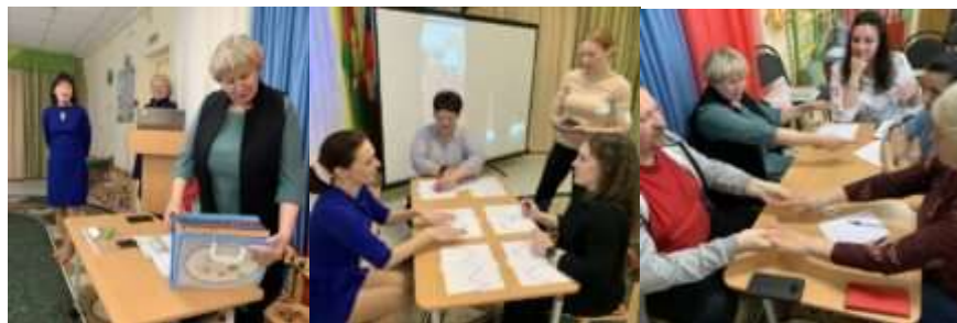
Семинар-практикум «Кинезеология в ДОО. Опыт работы»

28 марта 2024 года на базе МБДОУ д/с № 28 «Ладушки» МО г-к Геленджик для педагогов дошкольных образовательных организаций города состоялся семинар-практикум «Кинезеология в ДОО. Опыт работы».